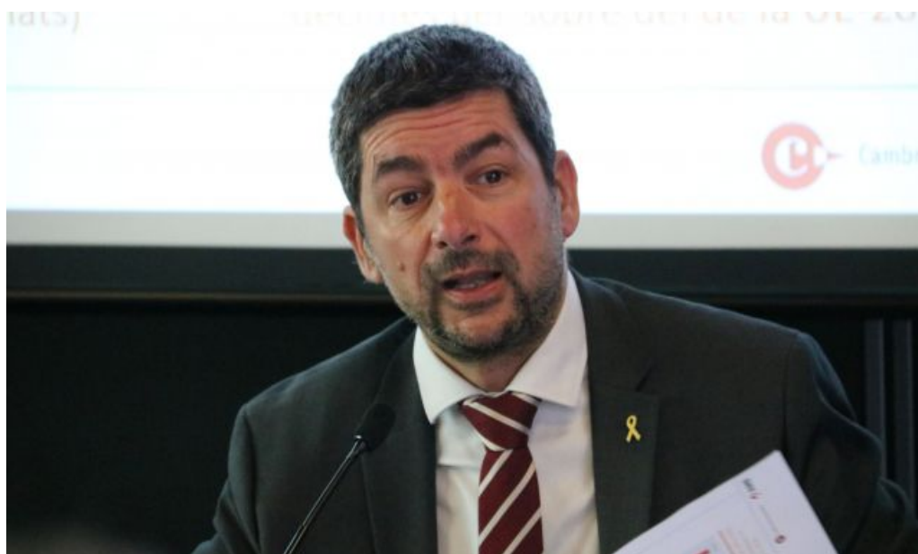
Joan Canadell, president del Consell de Cambres de Comerç de Catalunya, en una imatge d'arxiu

"No volem veure desaparèixer milers d'empreses, autònoms i llocs de treball". El Consell de Cambres de Catalunya reclama més mesures per frenar el coronavirus i la crisi econòmica que hi va associada a causa de les restriccions que s'han establert a tot el món per tal d'aturar l'avançament d'aquesta pandèmia. A través d'un comunicat, s'han mostrat favorables al confinament de Catalunya , una mesura que reclamava el president de la Generalitat, Quim Torra , la setmana passada.