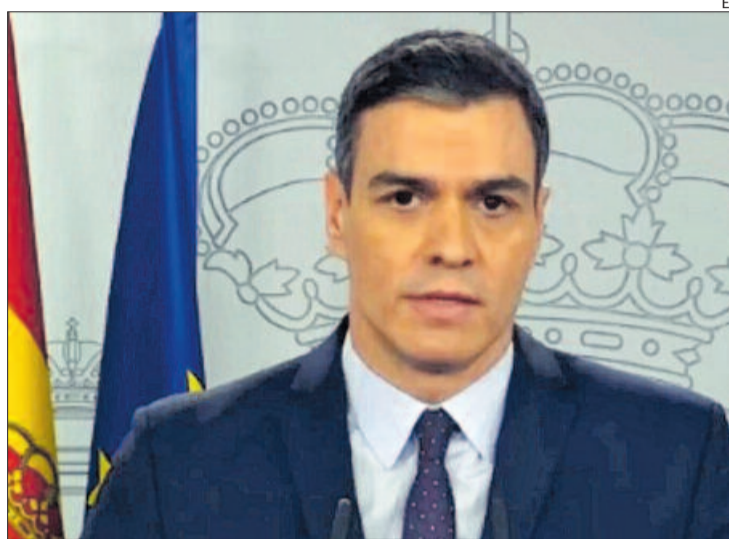
El president del Govern espanyol, Pedro Sánchez

També s'ha aprovat l'exoneració del pagament de cotitzacions a les empreses que, en lloc d'acomodar treballadors, s'acullin a expedients de regulació d'ocupació temporals (ERTO). Tots els ERTO es consideraran fets per força major, es gestionaran amb rapidesa en un termini de cinc dies, i tots els treballadors afectats per aquests procediments tindran dret a cobrar l'atur encara que no compleixin el període de cotització mínim exigint per a això. A més,