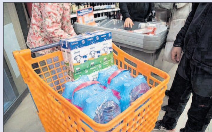
Un client compra aigua i llet en un supermercat

Un altre dels establiments que han notat un augment de les vendes és el Forn de Cabrianes del passeig de Pere III. En aquest sentit, una de les dependents va explicar que hi ha hagut un increment «important» del nombre de