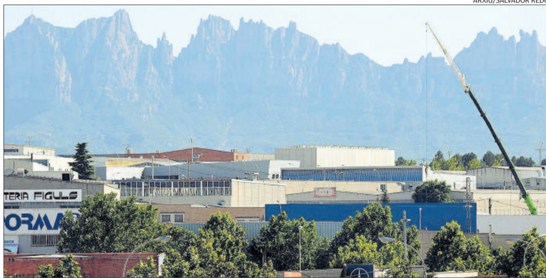
Vista general del polígon de Bufalvent de Manresa

Al polígon de Bufalvent, la situació era ahir de molta calma, «similar a un dia de vaga», deia