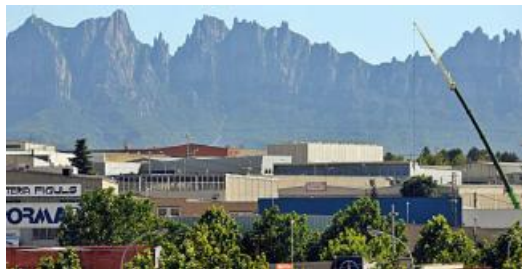
Vista general del polígon de Bufalvent de Manresa

La crisi del coronavirus ja ha deixat la indústria bagenca en estat d'alarma. Hi ha empreses locals que estan en mínims de proveïment i la setmana entrant haurien de plantejar-se mesures per contenir la producció. La setmana que ve és clau, segons les fonts consultades. Sempre que aquest cap de setmana les administracions no prenguin noves mesures que empitjorin els ja mals pronòstics.