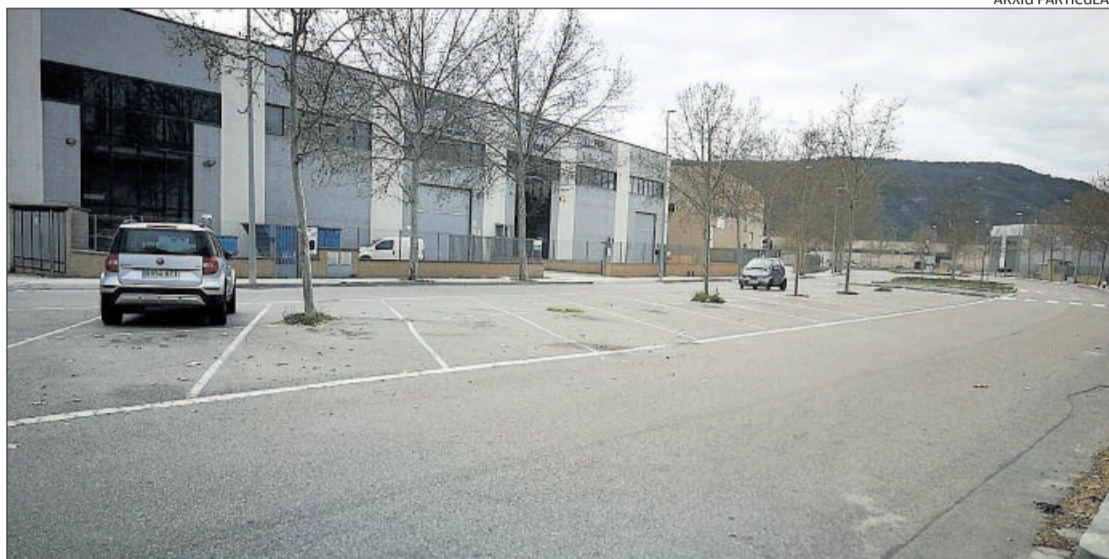
El polígon de Plans de l'Arau, ahir al matí sense pràcticament activitat

L'empresa, que a la tarda va poder treballar amb el 35% de la plantilla, assegurava que hi havia hagut «descoordinació» per part de Mossos en el tall, ja que haurien arribat agents de fora del territori sense prou coneixement del terreny i el confinament es va iniciar en un lloc inadequat per mantenir certa activitat a les empreses del polígon. Els camions