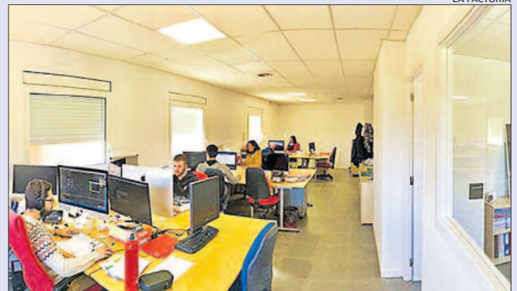
Oficines de La Factoria a Cabrianes

La Factoria ha participat en altres edicions del MWC. El primer any que va fer-ho, el 2013, va presentar-hi el MakerPF 4.0, un software