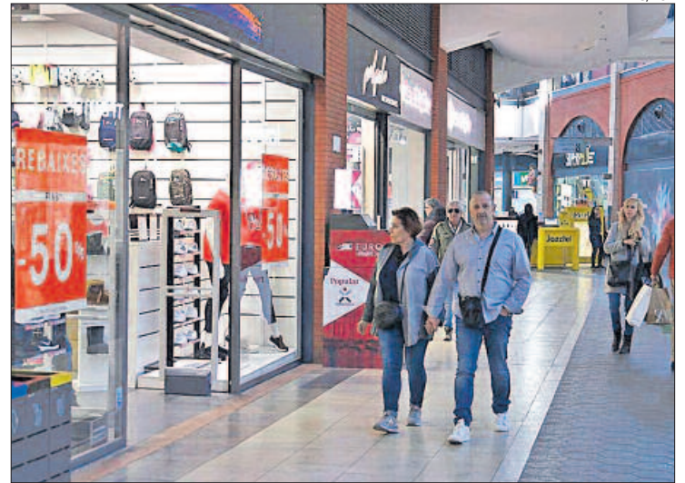
Compradors en un centre comercial

Encara que les dades «no estan desagregades», si es compara el consum del primer i tercer trimestre,