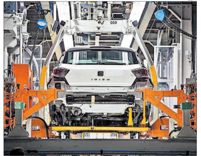
Planta de Seat a Martorell

Com a alternativa a l'ERO, el comitè ha plantejat que es consi-