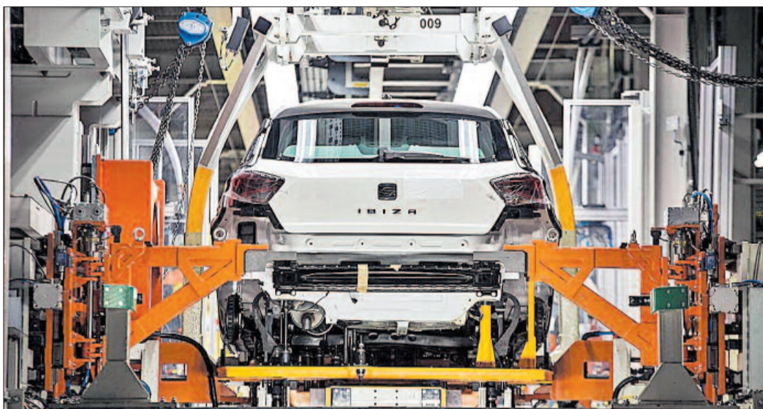
Interior de la planta de Seat a Martorell.

A més de renunciar a presentar l'expedient, l'empresa ha acceptat