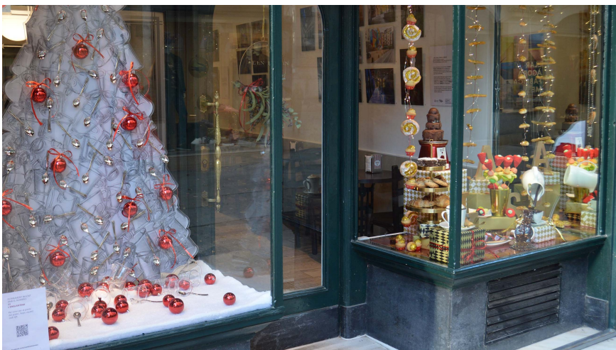
Imatge de l'aparador de l'Englantina.

La Cambra de Comerç de Manresa posa en marxa una nova edició, la 52ena, del tradicional concurs d'aparadors de Nadal. El proper dilluns dia 2 de desembre s'obre el període d'inscripcions per a tots els establiments que vulguin participar-hi. La inscripció és gratuïta i s'hi poden apuntar tots els comerços de la ciutat de Manresa. Hi ha temps per fer-ho fins el dia 16 de desembre.