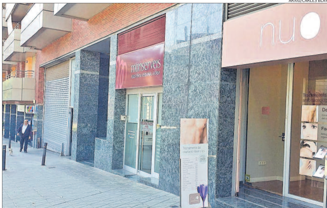
Oficines de Monserveis a Manresa

D'altra banda, el sindicat va explicar que l'octubre va crear «una Secció Sindical de la CGT a Monserveis, l'existència de la qual ha estat comunicada a l'empresa aquesta setmana». A més, ha posat «fins a sis denúncies a la Inspecció de Treball i dues als jutjats», i ha impugnat «les eleccions sindicals que la UGT havia convocat amb connivència i en col·laboració amb l'empresa».