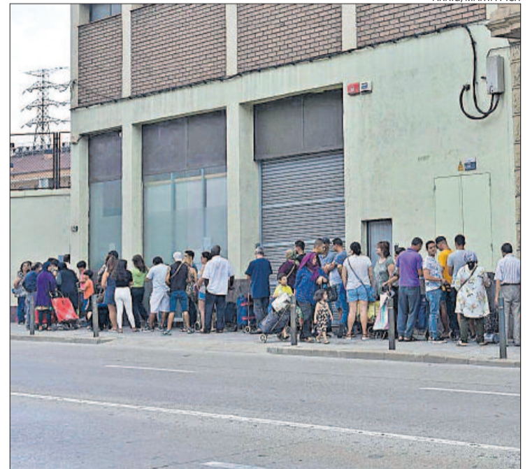
Cua al banc dels aliments de Manresa

«Aquestes dades són un reflex més de les discriminacions i desi-