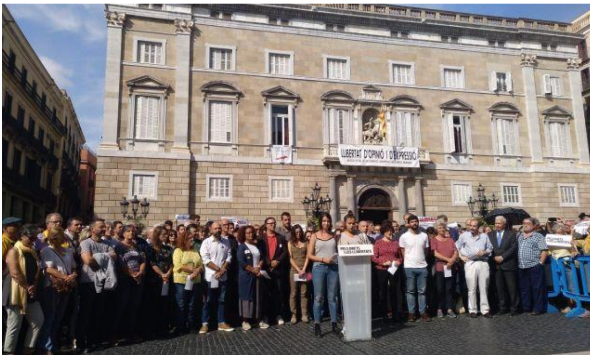
Més de 100 entitats, patronals i sindicats se sumen al manifest 'Pels drets i les llibertats' | UGT

conflicte polític per la via judicial són només alguns dels elements que han unit totes les entitats, institucions, patronals i sindicats que han volgut reivindicar el diàleg , així com articular una resposta unitària davant d'aquesta condemna als líders polítics.