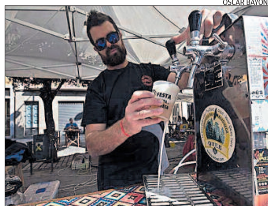
Estand de cervesa al certamen de Sallent