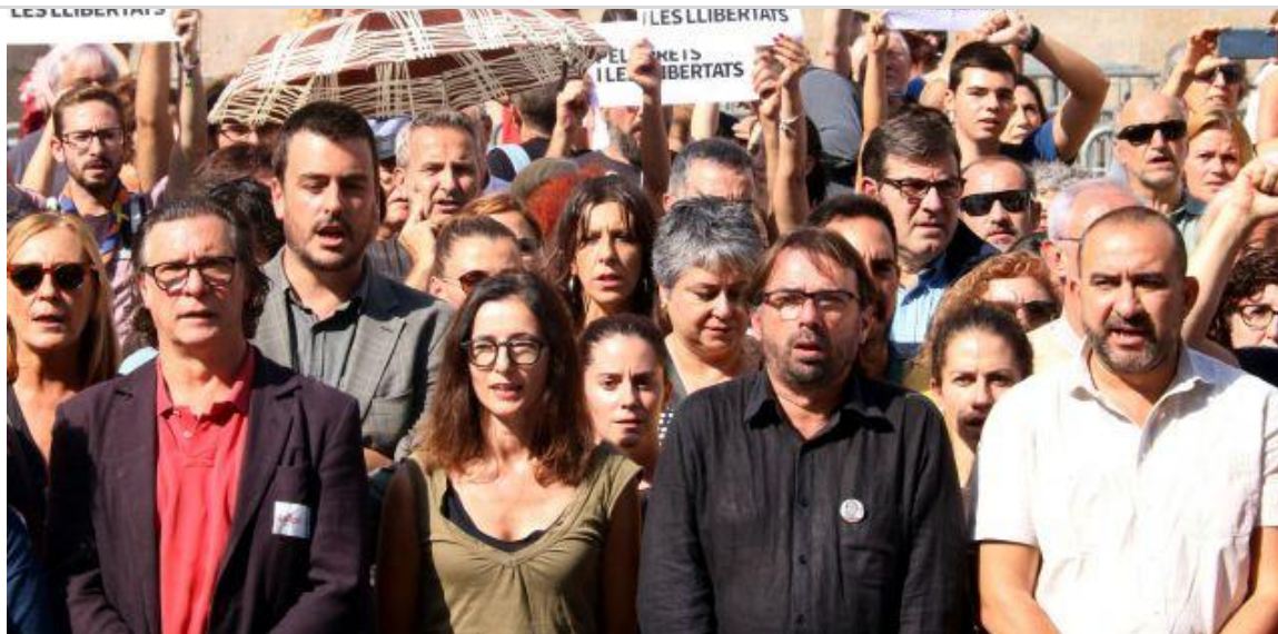
Sindicats, entitats i institucions es manifesten a la plaça Sant Jaume contra la sentència

Més tard, han enviat un comunicat lamentant que "la judicialització del procés ha provocat que es posin novament en qüestió els drets i llibertats d'expressió i de manifestació i, per tant, els drets pels quals hem lluitat tants anys des del nostre sindicat", així com que aquesta sentència "també afecta drets socials i democràtics, no només de les persones afectades per la sentència" perquè, destaquen, "significa la culminació de la judicialització d'un conflicte polític, i la presó que dictamina no podrà contribuir a resoldre'l".