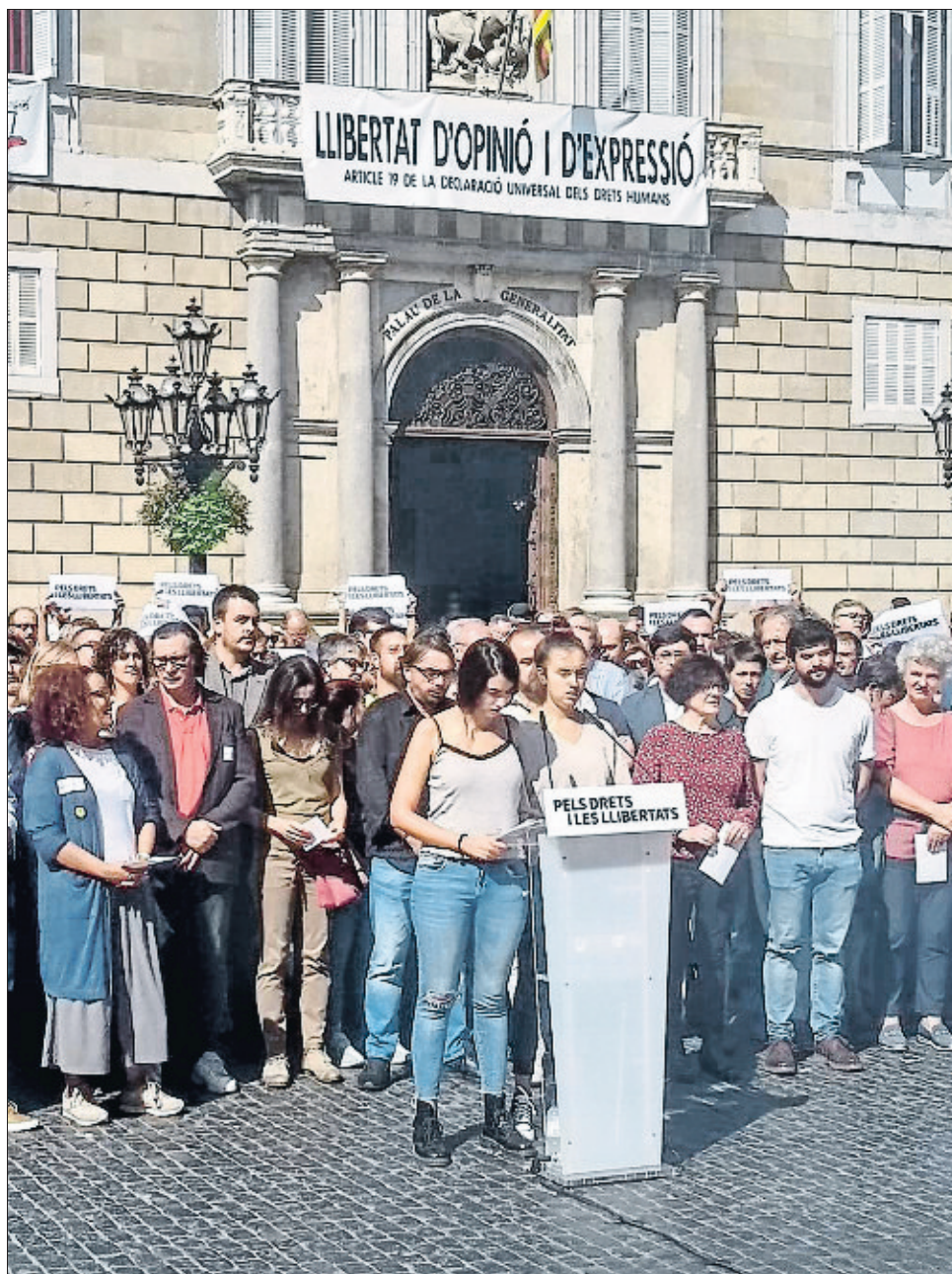
Plaça Sant Jaume