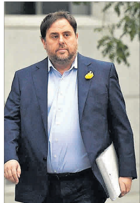
►► Oriol Junqueras.

Utilitzar la sentència com una ratificació a posicions polítiques i condemna de les contràries allunya la solució