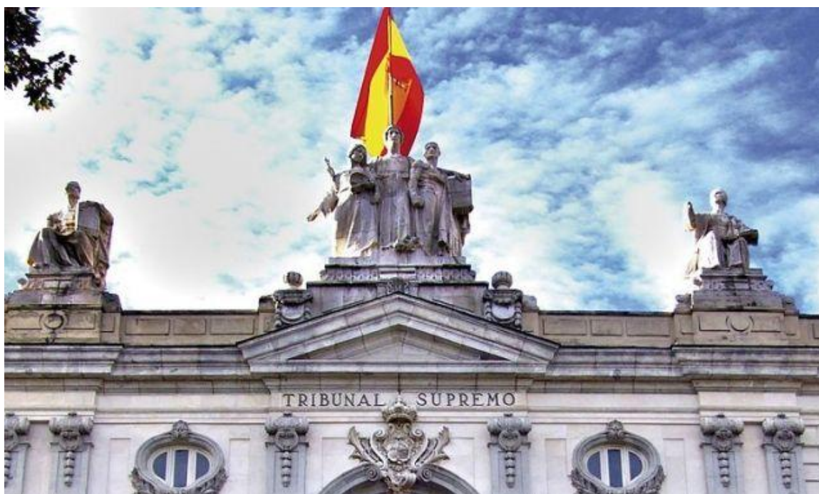
La façana principal del Tribunal Suprem | Cberbell

Poc després de les 9 del matí, sortia a la llum l'esperada sentència del judici del procés amb condemnes que van des dels 9 anys de presó fins als 13. Les reaccions no s'han fet esperar. Patronals i sindicats s'han afanyat a mostrar el seu rebuig a les accions judicials vinculades a uns fets polítics i més de 100 entitats s'han afegit a la convocatòria Pels drets i les llibertats per fer pinya i escenificar unitat d'acció contra la sentència.