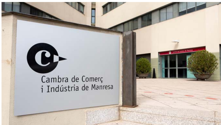
La Cambra de Comerç de Manresa subscriu la declaració institucional del Consell General de Cambres de Catalunya.

aturada de país però han manifestat que respectaran la resposta majoritària de la ciutadania.