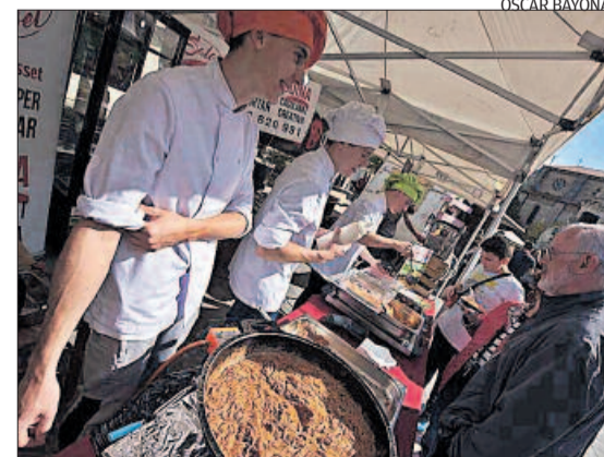
Els visitants també podien degustar menjar