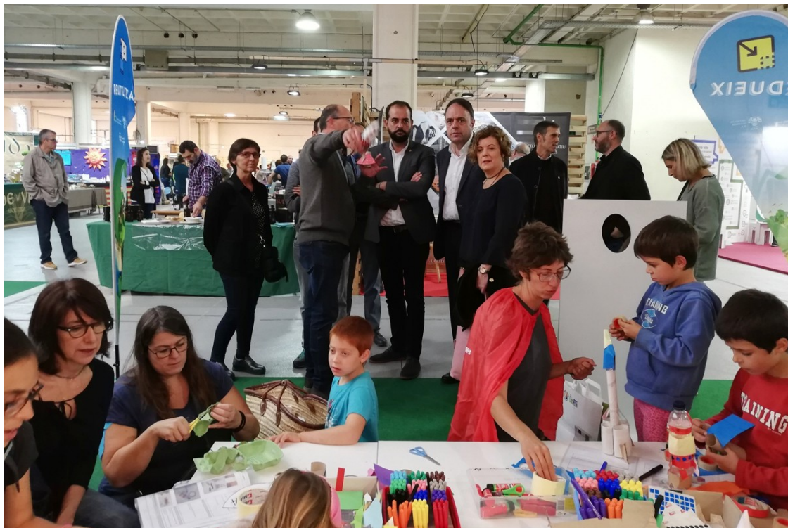
Inauguració de l'Ecoviure, aquest dissabte | Fira Manresa