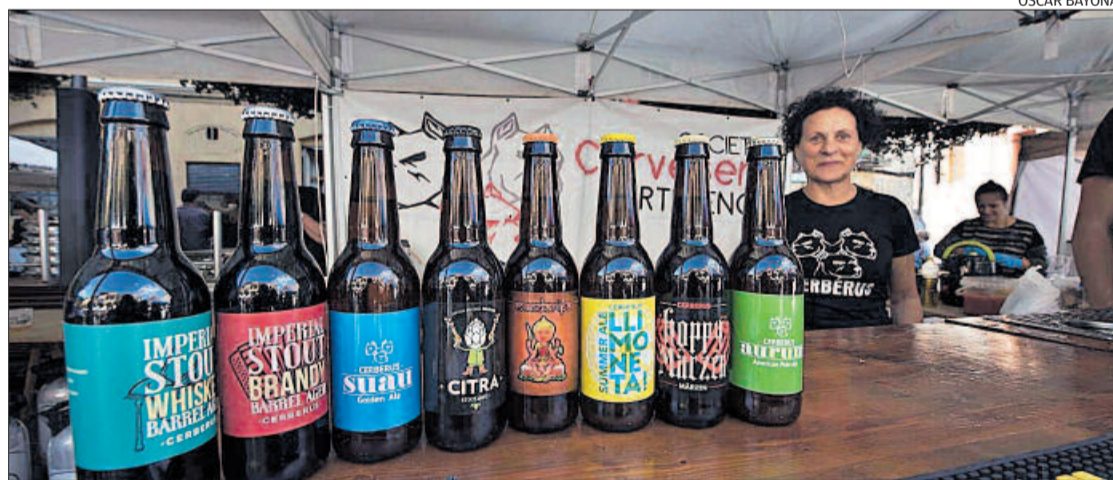
Productor de cervesa ahir a la fira que va tenir lloc a Sallent

Els comerciants van programar al llarg del dia un seguit d'actes per ambientar més la plaça de Sant Antoni Maria Claret. A les 4 de la tarda hi havia animació per a infants a càrrec de l'agrupament Roques Albes, i també hi va haver actuacions musicals de diferents estils.