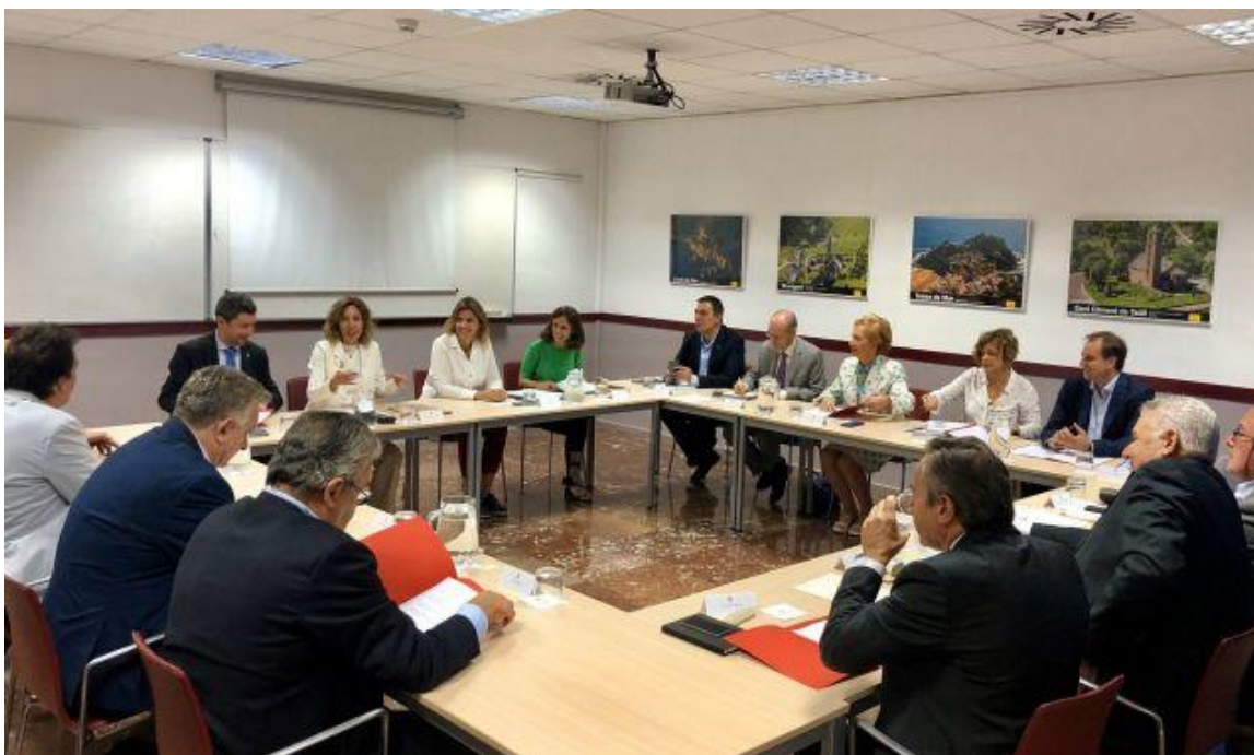
La Conselleria d'Empresa es reuneix amb els 13 presidents de les Cambres de Comerç de Catalunya

"Definir com funcionen les cambres, la seva relació amb els ens socioeconòmics i amb l' administració i desenvolupar l' equilibri territorial ". Aquest ha estat el tret de sortida de la reunió entre la consellera d'Empresa i Coneixement, Àngels Chacón , i els presidents de les 13 Cambres de Comerç de Catalunya per iniciar l'elaboració del nou esborrany de la Llei de Cambres del territori català. Una llei que fa anys que s'espera, concretament des que el 2010 el Govern de José Luis Rodríguez Zapatero va anunciar que els