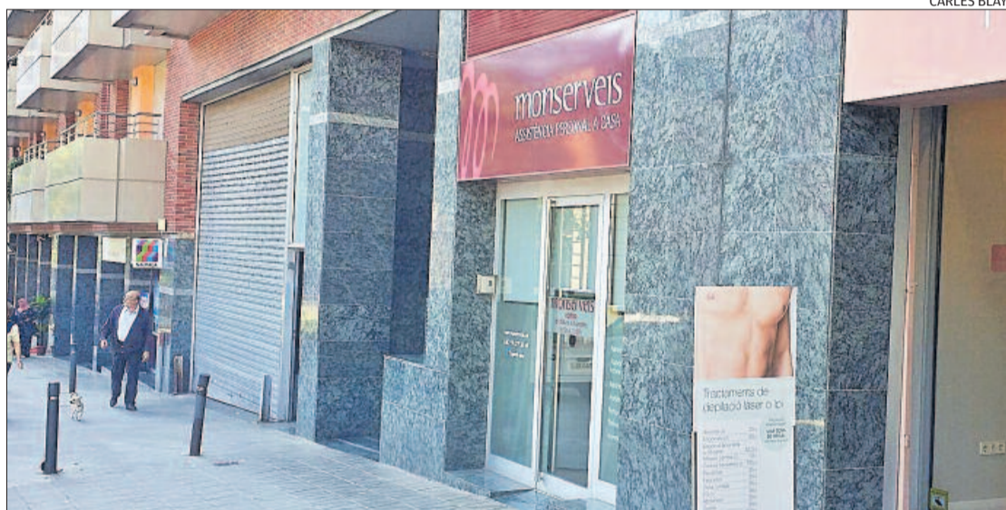
Façana de la seu manresana de Solubages SL, que opera amb el nom comercial de Monserveis

Es tracta d'infraaccions «de caràcter molt greu i constitutives d'un delictes penal», per a les quals es preveuen penes de presó de sis mesos a sis anys i multa de sis a dotze mesos. A banda de posar el cas en coneixement de la Fiscalia, la Inspecció de Treball ha propo-