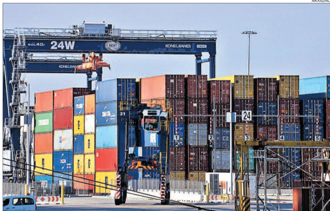
Les exportacions al Regne Unit van suposar, l'any passat, el 5,5% del total català

Per territoris, Barcelona lidera les exportacions catalanes al Regne Unit, amb el 76,9% del total. A més, són el 16% de les estatals. En xifres generals, Barcelona va ex-