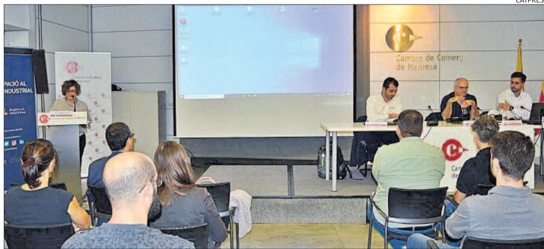
Un moment de la jornada celebrada ahir al matí a la Cambra de Comerç de Manresa

► Realitat augmentada i visió artificial, eixos d'una sessió per a la indústria