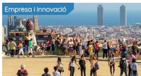
Recels, hotels i opacitat de la taxa turística