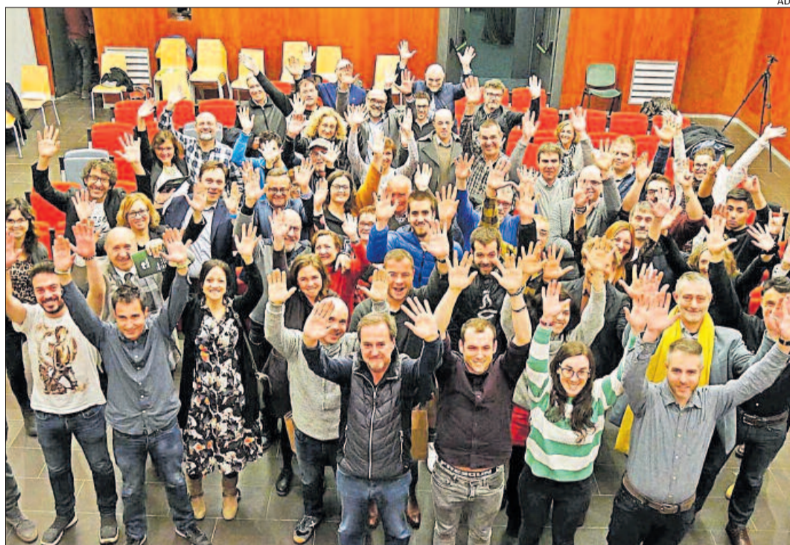
L'Agència de Desenvolupament del Berguedà organitza la vuitena edició del concurs d'empredoria

En l'edició d'enguany es donarà continuïtat al format adoptat l'any passat, basat a centrar el concurs a través del món audiovisual. El concurs es portarà a terme per Xarxa TV, en format de programa diari, on cada emprenedor disposarà de 20 minuts per explicar el seu projecte emprenedor. Com a novetat en el desenvolupament televisiu, les filmacions del programa es faran en una part a les instal·lacions dels emprenedors, fet que pretén aproximar a l'espectador la realitat del dia a dia dels diferents emprenedors i donaran un nou dinamisme al pro-