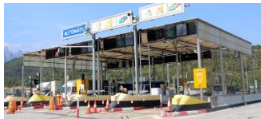
El peatge de la C-16 a Sant Vicenç de Castellet

Malestar entre els empresaris del Bages pel fet que, a partir de setembre, serà necessari tenir el Teletac o l'aplicació Satelize per gaudir dels descomptes del 45% que s'apliquen des de fa 20 anys, de dilluns a divendres i a totes hores, a la C-16 .