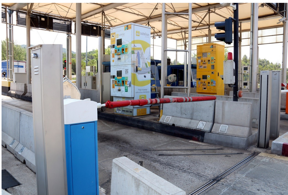
Peatge de la C-16 a Sant Vicenç de Castellet

La Cambra de Comerç i el Consell Comarcal exigeixen una nova pròrroga i lamenten la poca informació