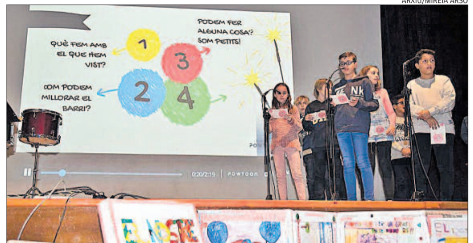
Inici del curs escolar 2018-2019 a l'Institut Lacetània de Manresa