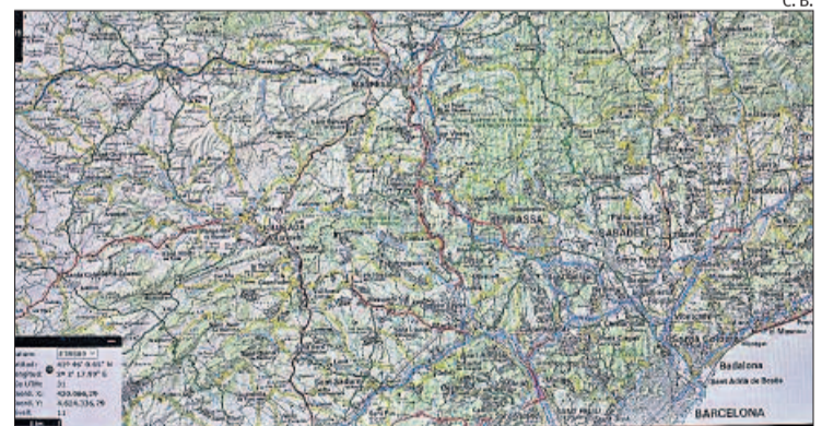
Exemple de CROMOS al visor SIGPAC

Agricultura apunta que des de l'any 2005 és possible l'accés a les dades de les explotacions agràries en format alfanumèric i gràfic, fet que permet la millora de gestió de les explotacions i pretén esdevenir una eina al servei tant del sector com dels agricultors a títol individual. Les dades es poden obtenir