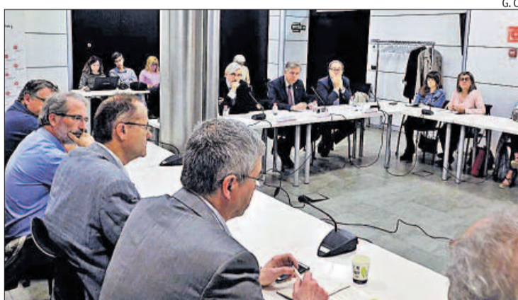
Un moment de la jornada celebrada a la seu de la Cambra

Què és la governança? Segons el Termcat, una manera de governar fonamentada en la interrelació dels organismes encarregats de la direcció política d'un terri-