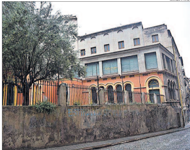
L'Ateneu de les Piques és molt a prop de la Plana de l'Om

Els anys 90 s'hi van fer unes obres de millora i va obrir com a local de restauració i punt de trobada. Va tancar i el 17 de setembre del 2001 es va inaugurar de nou com a restaurant i espai per acollir-hi activitats culturals per iniciativa d'Eva Babia, Carol Ferrer i Genoveva Gorchs, negoci que va tancar de manera definitiva l'any