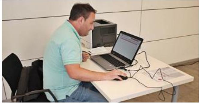
Jornada de votació presencial a la Cambra de Manresa, el 8 de

amb una aportació econòmica més gran només s'han presentat vuit candidatures. Així, l'ens constituirà el seu principal òrgan de govern a mitjan mes de juny amb només 39 de les seves 40 vocalies ocupades. Aquesta plaça vacant, però, es podria cobrir al llarg del mandat si alguna empresa compleix els requisits per entrar al ple mitjançant les aportacions mínimes.