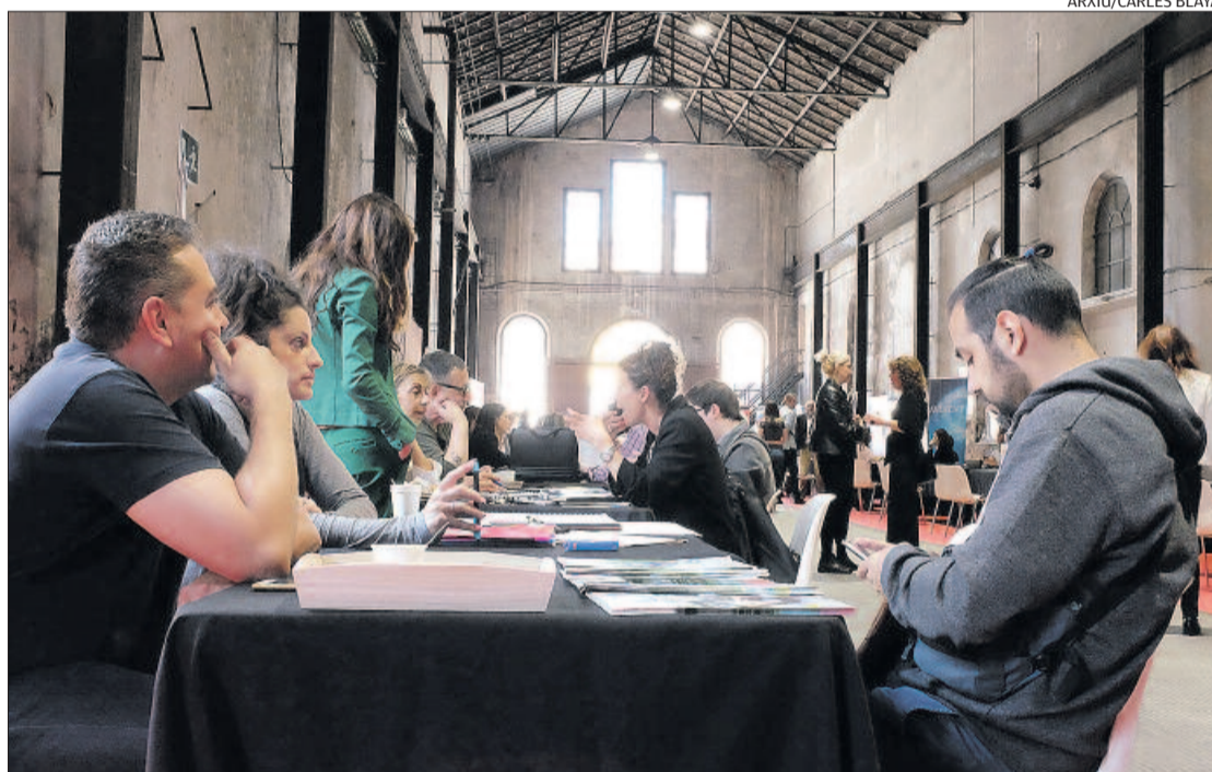
Un moment de la primera edició de la Fira de l'Ocupació, a l'Anònima

De moment, quan encara queden dies per tancar la llista de participants, ja hi ha vint-i-dues empreses inscrites, una menys de les que van prendre part l'any passat en la primera edició. Això fa preveure, segons els organitzadors, que la fira assolirà el nombre de participants màxim per l'aforament del recinte, a l'entorn de la trentena. Fins ara, ICL, Ampans, Montserrat, Grup Llobet, Denso, Fundació Althaia, Avinent, Deporvillage, Cots i Claret, Decathlon, Testamp, Aki, Leds-C4, Vidmar, Masats, Tecnum i Friman Garoina, a més de les debutants al certamen Maxion Wheels, Macsa, Vanderlande, Vidmar i UVE Solutions, ja hi han confirmat la seva