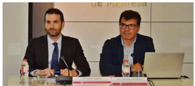
Un moment de la jornada celebrada a la Cambra

Els experts insten les empreses de la Catalunya Central a fer plans de contingència davant del Brexit, ja que apunten que, sigui quin sigui l'acord final, la situació resultant serà pitjor que l'actual. Per això, avisen les empreses que cal que estiguin preparades i que s'anticipin a possibles conseqüències. Així es va posar de manifest a la