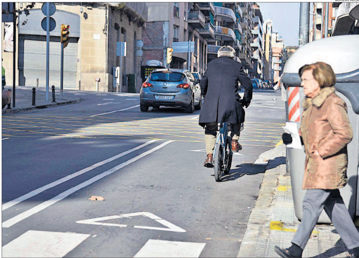
Un ciclista circulant pel carril bici del carrer Àngel Guimerà de Manresa, en direcció al carrer Barcelona