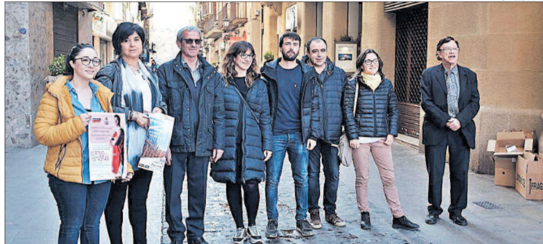
Promotors de la Setmana del Comerç de Manresa, ahir al Born