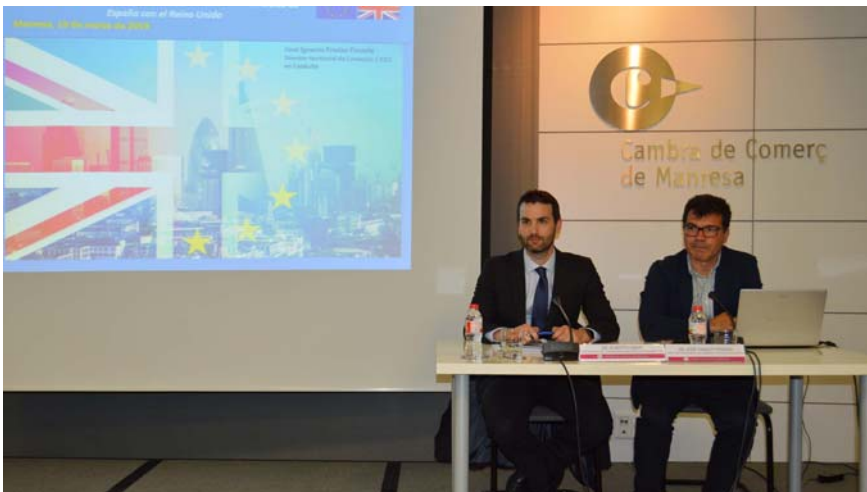
Els experts insten les empreses a fer plans de contingència davant del Brexit

Els experts alerten que un Brexit dur afectaria sobretot els sectors agrari, de béns d'equip, automoció i químic. Així es va posar de manifest a la jornada "L'empresa davant del Brexit" organitzada per la Cambra de Comerç de Manresa amb l'assistència d'una trentena d'empreses del territori amb activitat comercial al Regne Unit.