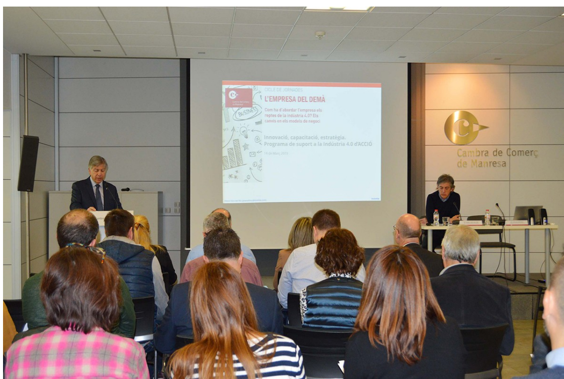
Sala d'actes de la Cambra durant la jornada d'indústria | Cambra

Una cinquantena de persones participen a la jornada del cicle "L'empresa del demà" organitzada en el marc del programa Ocupació al Bages Industrial