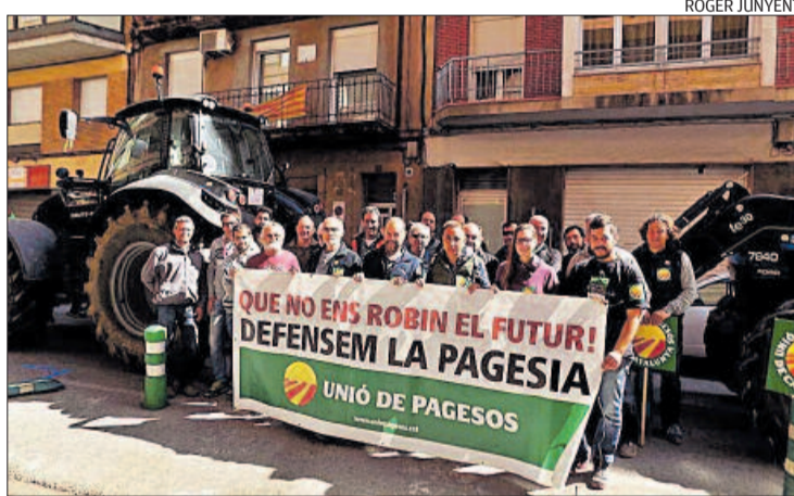
Els pagesos davant de la delegació d'Hisenda a Manresa

l'Anoia. La tractorada estava convocada en el marc d'una jornada de protesta i s'ha portat a terme de forma simultània amb tractorades a Lleida, Tarragona, Tortosa i Girona. Entre les mesures que reclamen els agricultors per aconseguir ser més competitius destaca la d'un gasoil professional, IVA reduït, eliminar perceptors fraudulents de la PAC i accions per pal·liar l'encariment de la mà d'obra al camp i de les cotitzacions a la Seguretat Social. L'impacte de les diferents mesures que reclama el sector se situa en uns 300 milions d'euros a Catalunya.