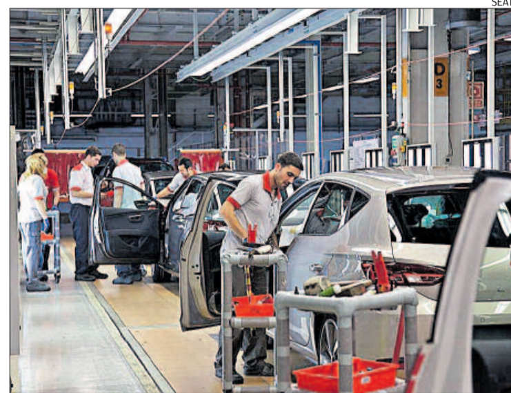
Interior de la planta de Seat a Martorell

De la seva banda, la línia 3, la responsable de l'A1, rebaixarà la producció en 12.200 unitats fins a