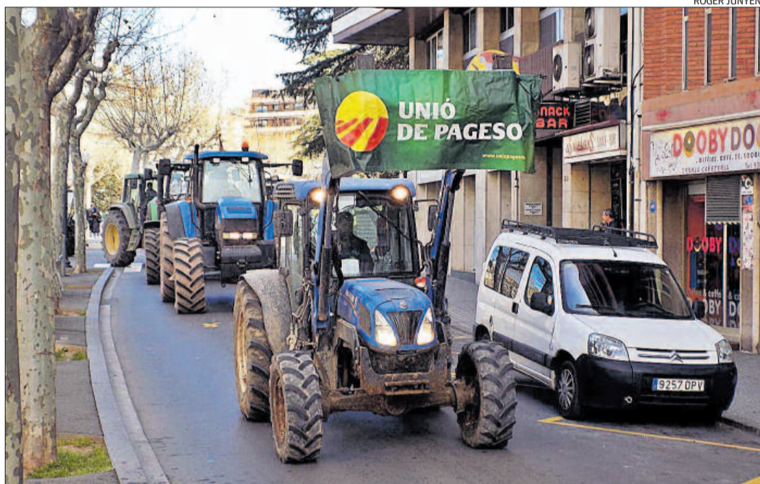
Els tractors al seu pas pel passeig de Pere III

A la concentració de Manresa també hi van participar agricultors d'altres comarques com el Berguedà, Osona, el Solsonès i