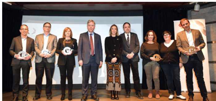
Guardonats en l'edició d'enguany dels premis empresarials de la Cambra de Comerç