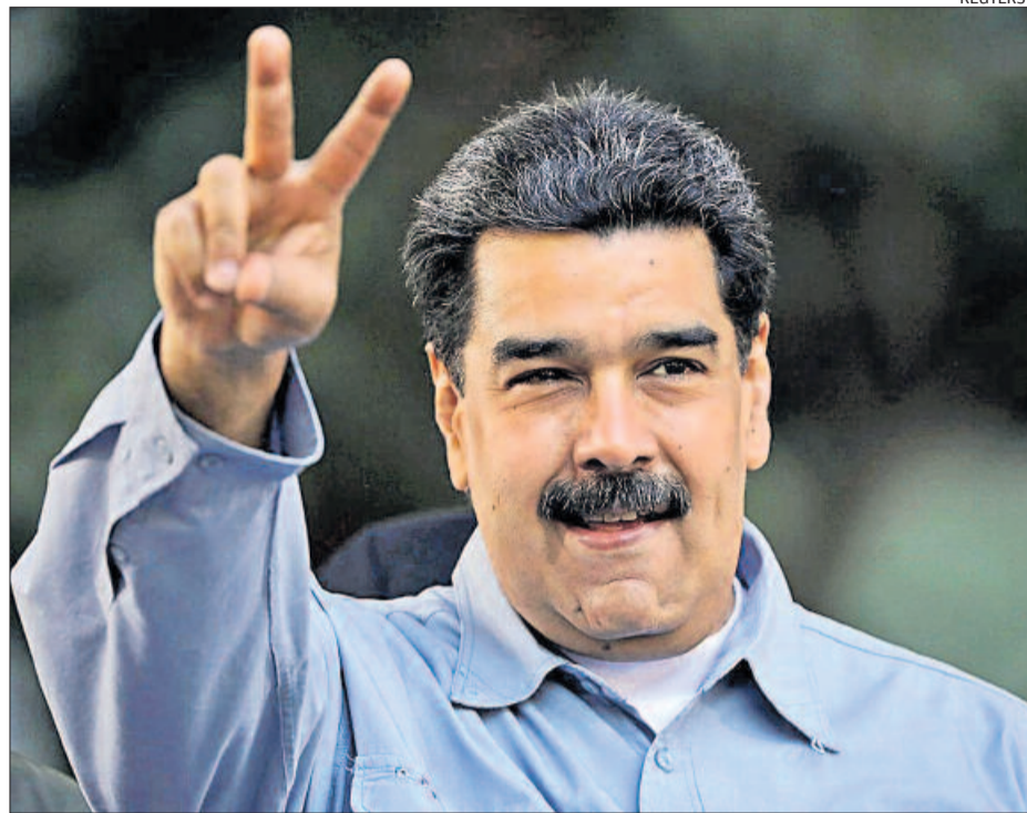
L'encara president de Veneçuela, Nicolás Maduro

El país de Nicolás Maduro és el més corrupte d'Amèrica Llatina, i supera així Haití, Mèxic, Bolívia, Brasil i Argentina. Nicolás Maduro, el successor d'Hugo Chávez, no només ha eliminat la divisió de poders, anul·lant l'Assemblea Nacional i controlant l'exèrcit i el Tribunal Suprem, sinó que ha estat l'artífex d'un dels grans desastres econòmics i socials, com a conseqüència de l'aplicació sistemàtica del socialisme chavista. Ha creat un Estat