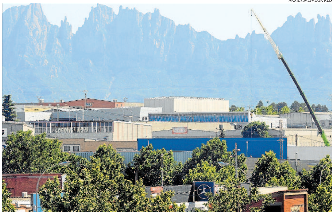
Vista parcial del polígon de Bufalvent de Manresa, en una imatge d'arxiu

D'altra banda, el sector exterior al creixement de l'economia catalana va ser del 0,6%, i representa una millora de quatre dècimes respecte al trimestre anterior. Els intercanvis amb l'estranger, amb un augment interanual de l'1,1%,