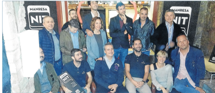
Representants de diferents locals de Manresa, que ja s'han associat

A dia d'avui en formen part 9 dels 15 locals d'aquestes característiques existents a Manresa. ■