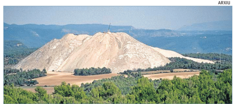
El futur de la mineria del Bages passa pel pla Phoenix

La Generalitat i ICL Iberia han establert l'any 2065 com a data límit per eliminar de forma definitiva el runam salí del Cogulló de Sallent. En un conveni signat el passat dovendres dia 13, s'insta a la filial d'ICL, Iberpotash S.A., a plantejar la restauració definitiva del Cogulló abans que s'acabi l'any i es reconeix l'eliminació del runam salí per dues vies: la comercial o dissolent el material i evacuant-lo al mar. L'empresa també es compromet a fer un tancament "progressiu" de les mines de Sallent i Balsareny, i impulsarà una àrea d'activitat "industrial estratègica" en aquesta zona. El