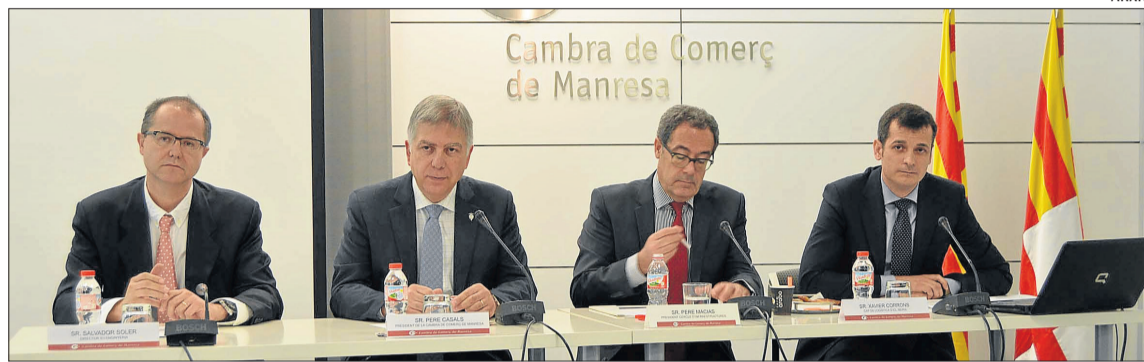
Presidència de la jornada sobre infraestructures celebrada a la Cambra de Manresa