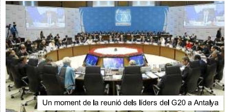
Un moment de la reunió dels líders del G20 a Antalya