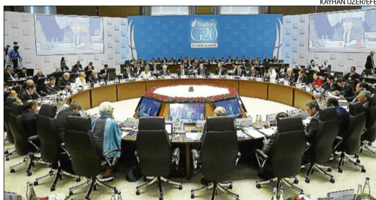
Un moment de la reunió dels líders del G20 a Antalya

El G20 segueix compromès amb impulsar el creixement econòmic mundial, que l'Organització per a la Cooperació i el Desenvolupament Econòmic (OCDE) ha reduït per a aquest any del 3,3% al 2,9%. Els líders polítics també reconeixen que «la creixent desigualtat» social és un motiu de preocupació i pot suposar no només «un perill per a la cohesió social», sinó que també pot «soscavar les perspectives futures de creixement». L'OCDE havia alertat abans de la cimera que la desigualtat era un motiu de preocupació ja que es troba en els nivells més alts en dècades a les economies desenvolupades, mentre que en els emergents és fins i tot pitjor.