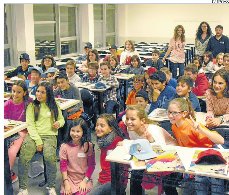
Els infants atents a les explicacions sobre el Geoparc

Totes les persones majors de 16 anys i les entitats poden participar en una AMO, inscrivint-se des de l'Ajuntament de Sallent. ■