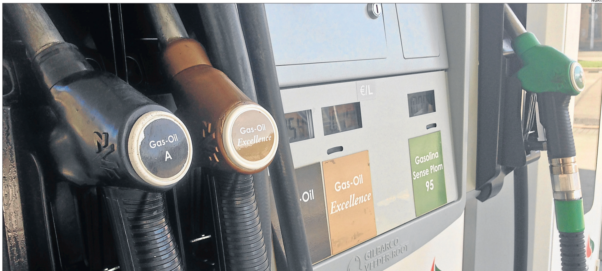
En els darrers quatre anys, l'oferta de gasolineres al terme municipal de Manresa s'ha vist ampliat en 6 punts nous de subministrament, 3 dels quals són de 'low cost'

Després d'uns anys d'estancament, el nombre de llicències per obrir una gasolinera al terme municipal de Manresa ha augmentat fins el punt que en poc temps se n'han