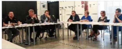
Fabián Mohedano (a l'esquerra), durant la seva conferència, ahir a la Cambra de Comerç de Manresa

CARLES BLAYAMANRESA El setembre de l'any que ve és l'horitzó que s'ha proposat la Iniciativa per a la Reforma Horària perquè el canvi de l'organització del temps sigui una realitat a Catalunya. L'objectiu consisteix a adaptar els horaris catalans als de la resta d'Europa: dinar i sopar d'hora, modificar el prime time televisiu, conciliar vida laboral i familiar, millorar la salut de les persones. Fabián Mohedano, expert en ciències del treball i relacions laborals, polític i promotor de la Iniciativa per a la Reforma Horària, va ser ahir al matí a Manresa per explicar aquesta proposta al comerç local. L'acte es va celebrar a la Cambra, davant poc més d'una desena de persones.