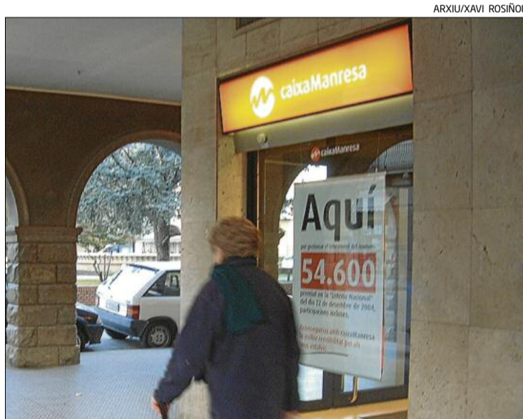
Exterior d'una antiga oficina de Caixa Manresa