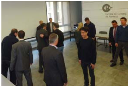
Els principis del judo es poden aplicar a les exportacions.

Però només amb seguretat es pot tenir èxit. Cal aplicar bé les tècniques. Les d'aquest mètode es divideixen en estar en moviment, tenir equilibri i aplicar el teu avantatge estratègic. Això sí, s'han d'utilitzar conjuntament.