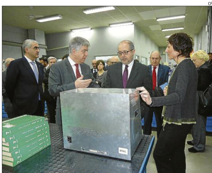
El conseller, durant la visita d'ahir al Centre de Formació Pràctica

Amb tot, sembla que la sortida laboral per la planta podria estar relacionada amb el camp de la biomassa, ja que el Govern ha expressat en diverses ocasions la seva voluntat de buscar alternatives que mantinguin l'activitat econòmica relacionada amb l'extracció de la fusta. El tancament de Tradema, destinada a la fabricació de taulers aglomerats, va deixar 140 persones a l'atur a finals del 2012 i ha tingut greus conseqüències per al sector forestal del territori.